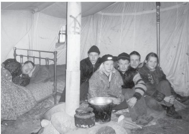
■ Валанцёры ў вайсковым намёце.