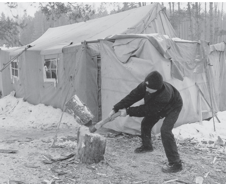
■ Нарыхтоўка дроваў каля валанцёрскага намёту.